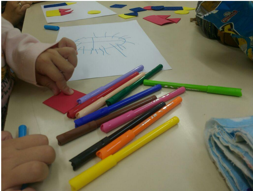
Imagem 1. Contação de histórias para a construção de sequência lógica