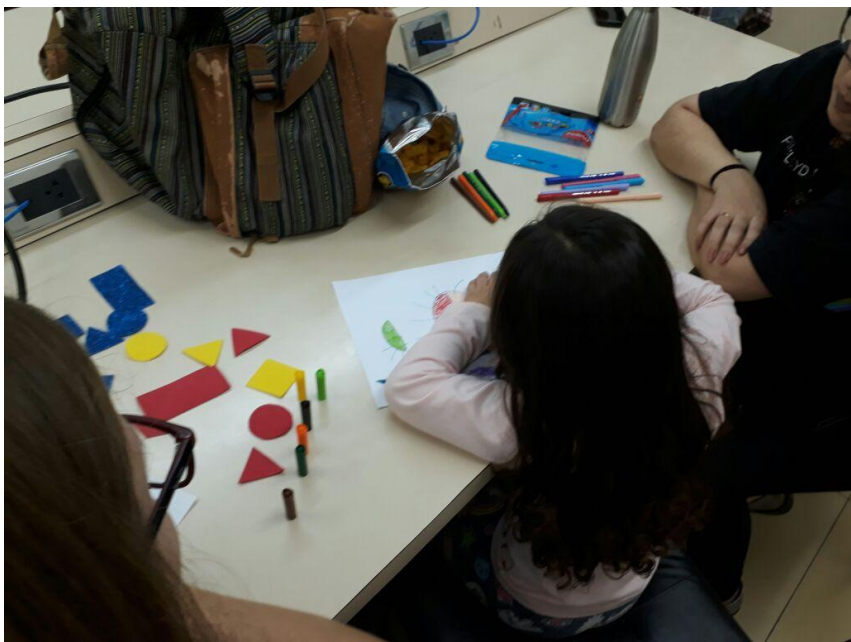
Imagem 2. Contação de histórias para a construção de sequência lógica