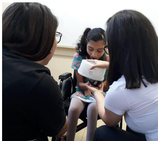
Figura 2- Aluna P. construção de número

Cada professor construí sua bagagem com informações adquiridas ao longo da sua vida profissional, acadêmica e profissional, e por isso é importante a troca de conhecimentos