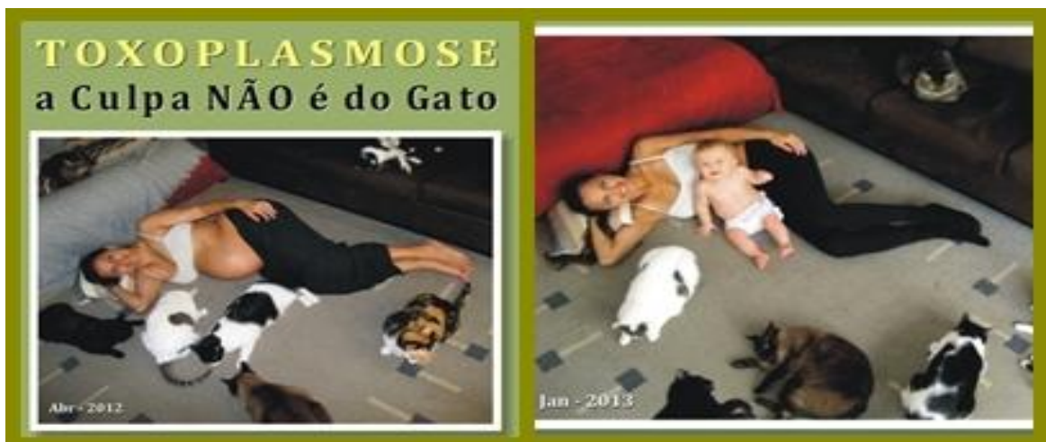
Figura 1 - A culpa não é do gato.