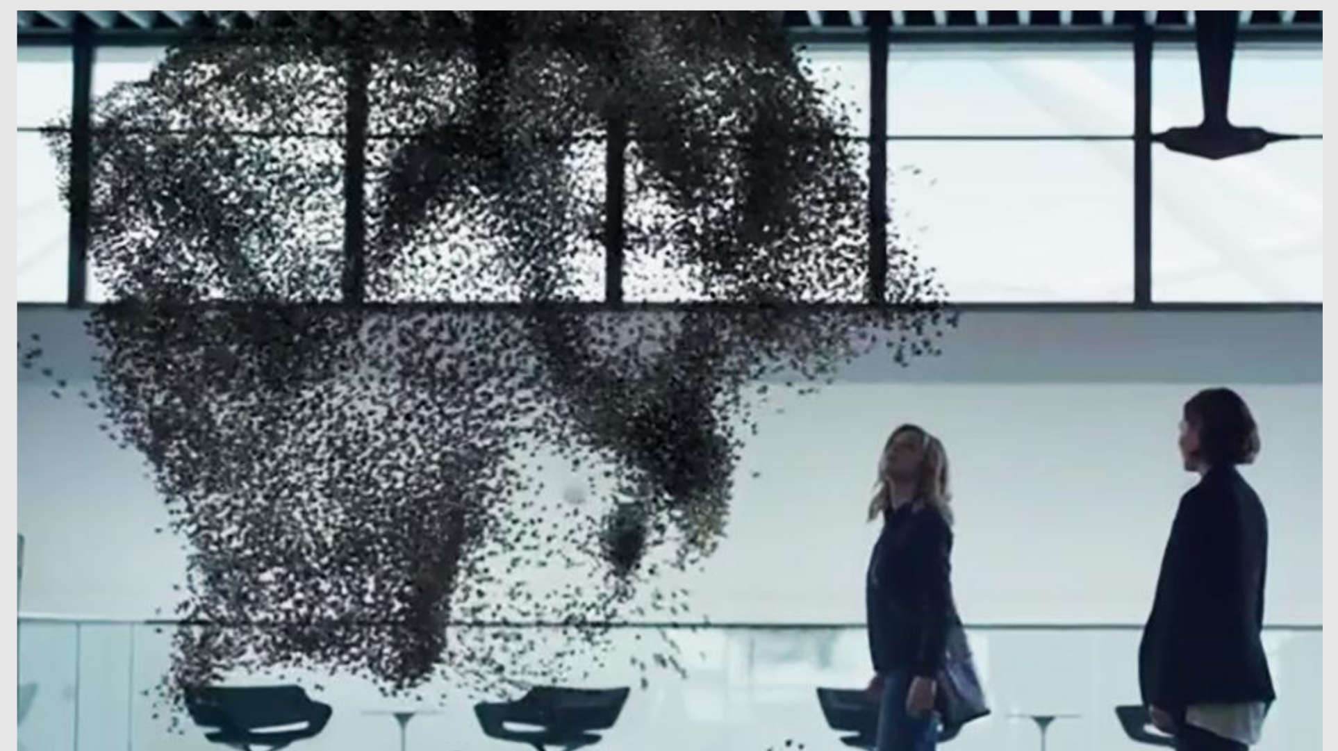
Figura 1 - Abelhas-drone fazendo demonstração de voo

A série faz uma projeção do futuro, ou até mesmo do presente, em histórias independentes que tratam de como a tecnologia impacta a vida dos personagens. Para esta pesquisa foi escolhido o sexto episódio da terceira temporada do seriado britânico Black Mirror, intitulado "Hated in the Nation" (Figura 1).