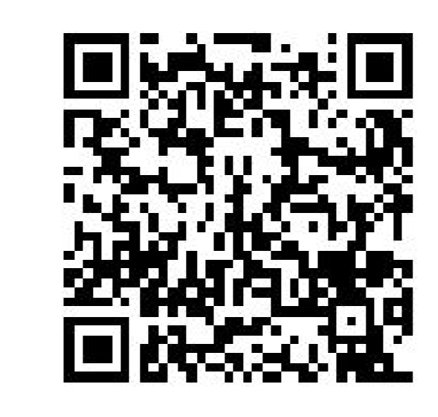
Figura 2. QR Code com as planilhas de materiais