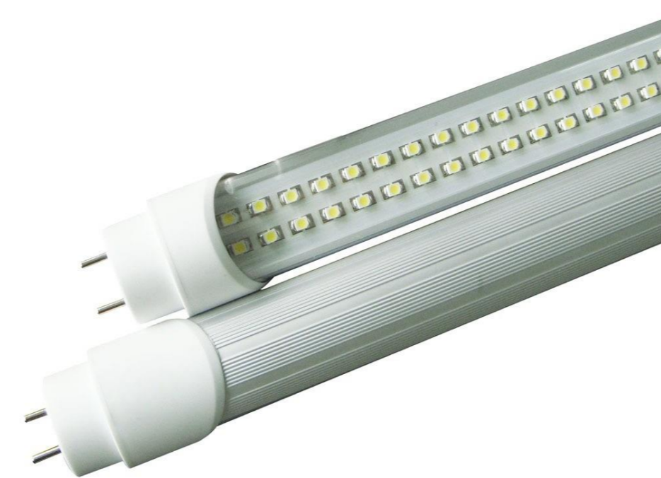
Imagem 03: Lâmpada LED Tubular.