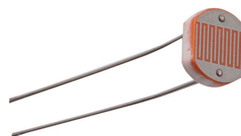
Imagem 01: LDR (do inglês Light Dependent Resistor ), em português Resistor Dependente de Luz .

MALVINO, Albert Paul. Eletrônica: Volume I – 4ª edição . São Paulo: Makron Books, 1995. BRANDASSI, Ademir Eder. Eletrônica digital I . Série Brasileira de Tecnologia. São Paulo: E.P.U. Editora Pedagógica e Universitária Ltda, 1982. MARQUES, Angelo Eduardo Battistini. Dispositivos semicondutores: diodos e transistores – 4ª edição . São Paulo: Érica, 1998. ASSOCIAÇÃO BRASILEIRA DE NORMAS TÉCNICAS. NBR 5413 . Iluminância de interiores. Rio de Janeiro, 1992.