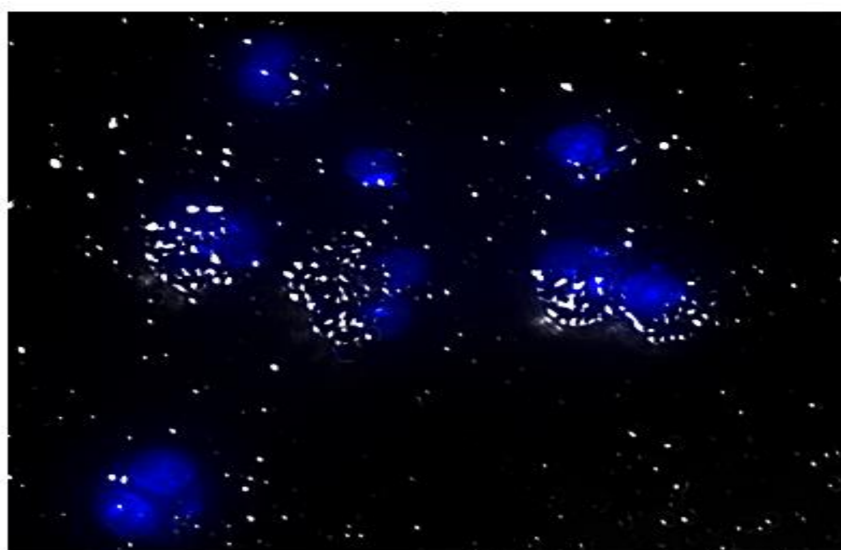
Figura 1. Microscopia combinando campo escuro e imagem fluorescente. Células CHO-K1 binucleadas tratadas com 53 µg/mL de NPs de NbO, fixadas com metanol e coradas com 10 µg/mL de DAPI. Núcleos celulares aparecendo em azul e NPs aparecendo como pontos brancos.

Após o tratamento das células com as NPs de NbO, foi observado um aumento significativo na frequência de MN, em todas as concentrações de NbO avaliadas, revelando a instabilidade cromossômica associada às NPs (Tabela 1). Não foram observados aumentos significativos na frequência de células binucleadas com PN e com BN. Somado a isso, os resultados revelaram que as NPs de NbO foram distribuídas e sedimentadas em células CHO-K1 formando agregados que passaram através da membrana celular, concentrando-se na região perinuclear (Figura 1).