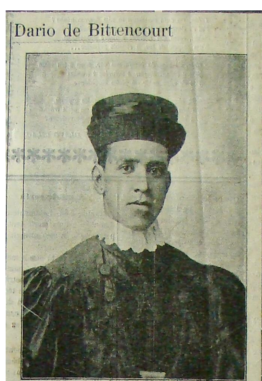
O Exemplo – Ano XXXIII, 04 de janeiro de 1925 NUM 1 - P. 1