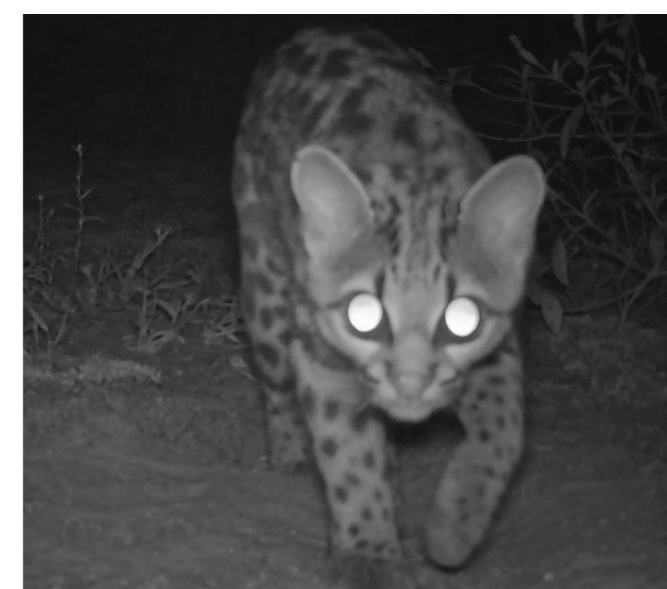
Imagem 3. Leopardus wiedii .