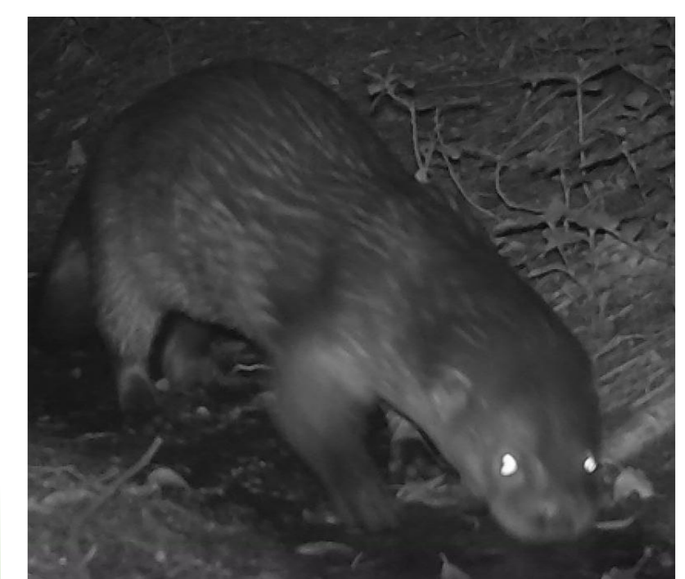
Imagem 4. Lontra longicaudis .