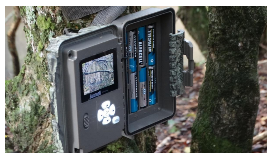
Imagem 1. Armadilha fotográfica Bushnell.

O estudo foi realizado na Reserva Biológica do Lami, que abrange um território de 204,04 hectares, localizada na região extremo-sul de Porto Alegre, às margens do Lago Guaíba e Arroio Lami. Foram utilizadas quatro armadilhas fotográficas dispostas em campo 24 horas por dia, de julho de 2018 a junho de 2019. Foi gerado um grid de medidas a partir da área limite da unidade, onde a cada mês sorteou-se quatro quadrantes para a instalação dos equipamentos. O trabalho de campo se deu uma vez a cada 30 dias, aproximadamente, para realocação das armadilhas fotográficas nos novos quadrantes sorteados, respeitando-se um limite de 200 metros entre si dentro de cada mês. Não foram utilizados atrativos alimentares para que não houvesse alterações comportamentais. As observações ocasionais diretas (observação do animal) e indiretas (vestígios: pegadas, fezes e tocas) também foram registradas.