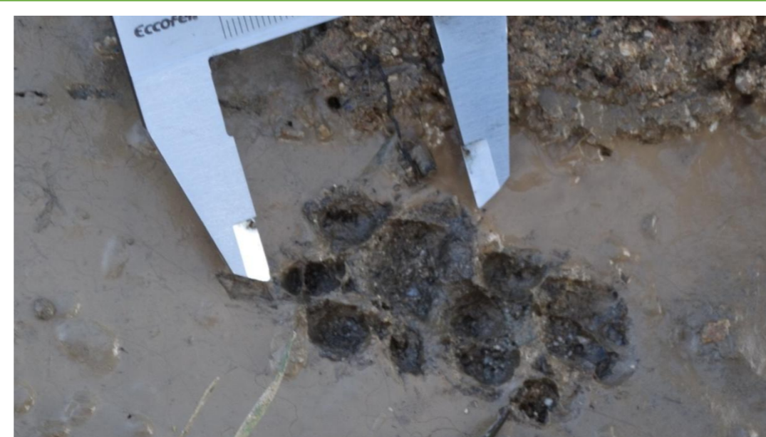
Imagem 2. Pegadas de felinos.