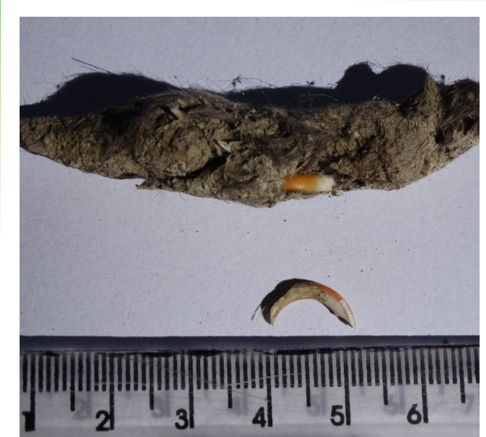
Imagem 6. Dentição de Ctenomys lami em fezes de Leopardus sp.