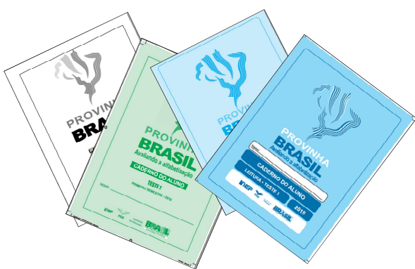
Capas da Provinha Brasil .

Observa-se na análise do material que para construir uma representação global na leitura das questões da avaliação, o alfabetizando precisa integrar múltiplas informações, e o texto, como um artefato cultural, fornece marcas discursivas para que essa integração seja feita. No entanto, o alfabetizando pode não percebê-las por, pelo menos, dois motivos: porque não prestou atenção nessas marcas ou porque seus conhecimentos prévios ou experiências cotidianas não permitiram que ele as reconhecesse dessa forma.