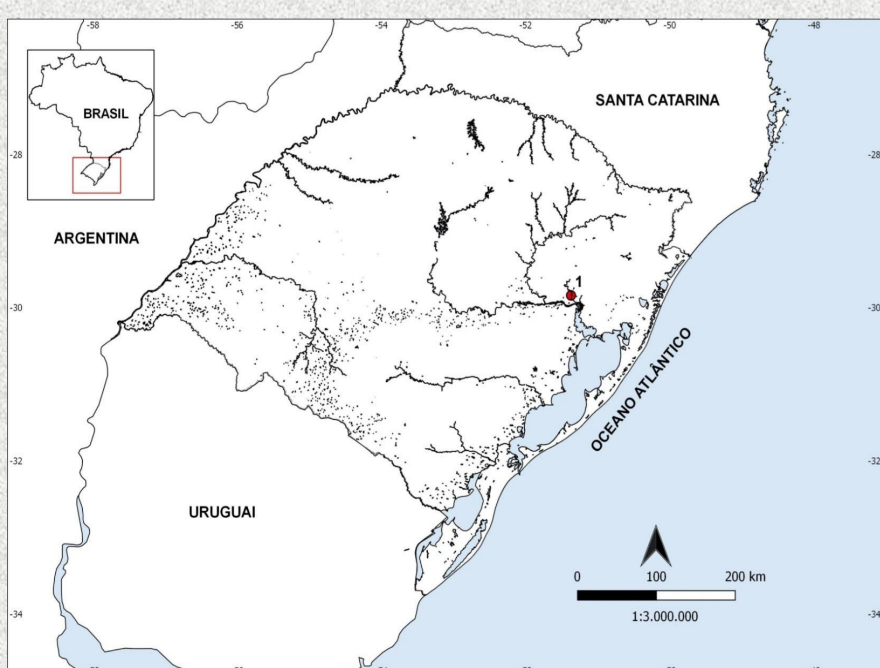
Figura 1: Mapa da localidade de coleta. 1. Triunfo –RS