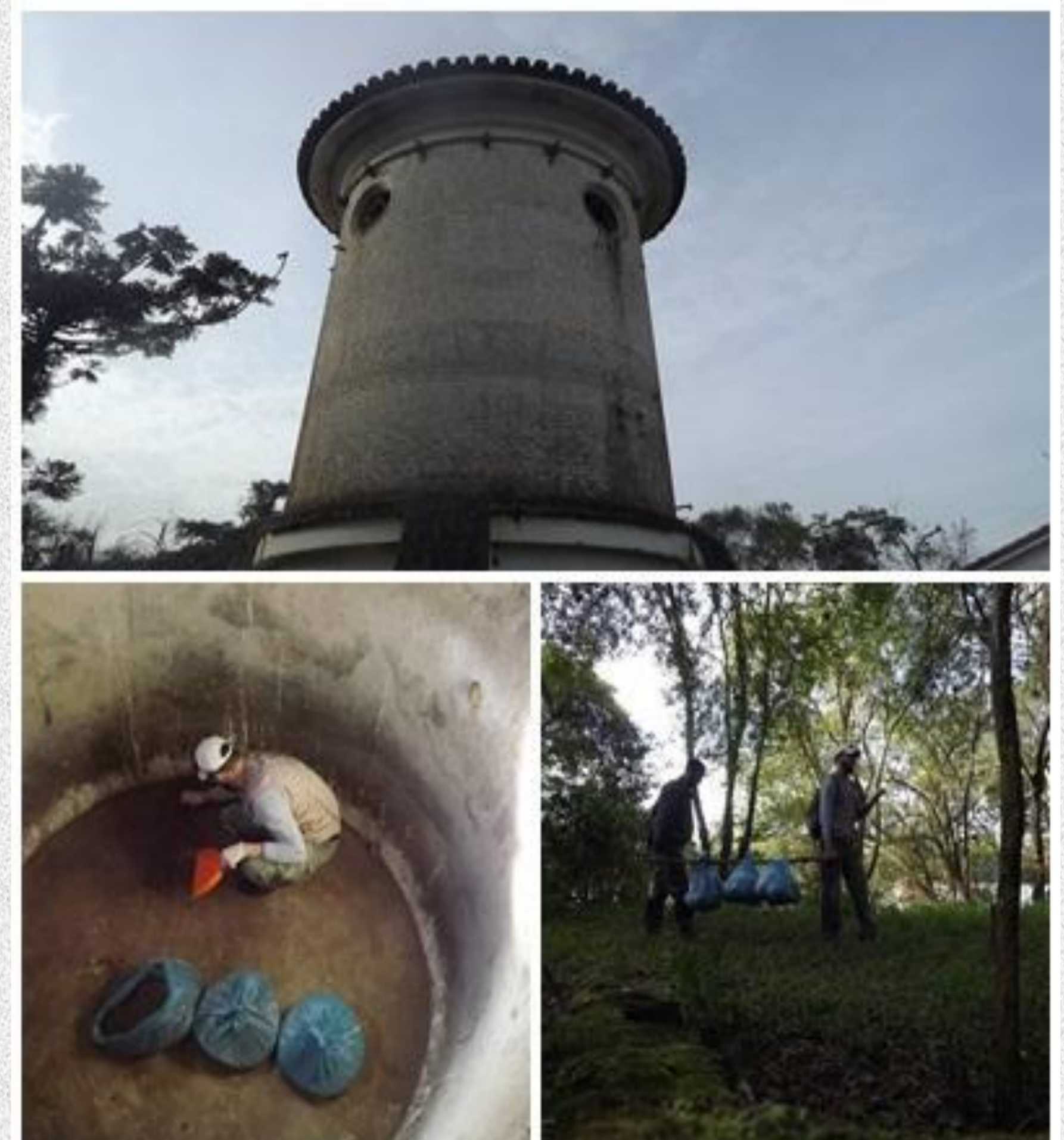
Figura 2: Fotos da localidade de coleta dos fragmentos.

O ninho foi reconhecido durante um trabalho de campo no município de Triunfo, RS. Este estava localizado dentro da torre de uma caixa d'água desativada nas margens do rio Caí (UTM 22 J 464202/6699196). Neste local foi percebida a presença de fragmentos ósseos procedentes de egagrópilos (produto de regurgitos) das aves de rapina. O material foi coletado e armazenado em seis sacos de 50 litros, para posterior triagem, análise e identificação no Laboratório de Sistemática e Evolução de Mamíferos do Museu de Ciências Naturais da Ulbra (MCNU). O material foi previamente esterilizado com álcool 70% e posteriormente triado e separados em peças como crânios, maxilas, mandíbulas e dentes. As peças foram separada em morfogrupos crânio-dentário e então feita a identificação, comparando os fragmentos ao material de referência depositado na coleção de mamíferos do MCNU. Sendo os mesmos identificados em nível de gênero.