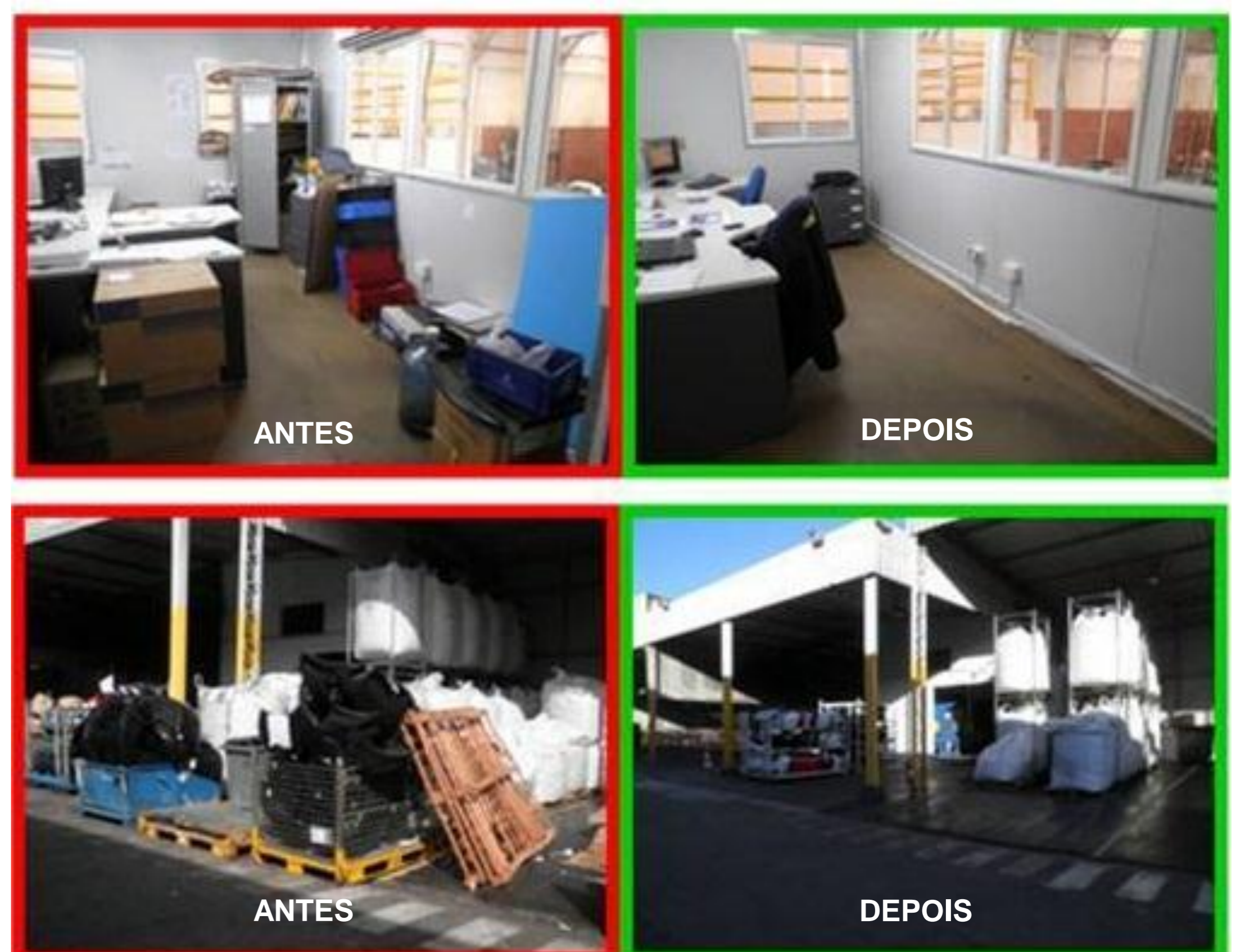
Figura 1: Representação fotográfica do antes e depois da implantação do 5S.

Ao longo da implementação do 5S na empresa, observou-se melhorias no layout dos setores com melhor aproveitamento de espaço, organização e limpeza dos ambientes. A empresa busca a longo prazo uma diminuição significativa nos índices de acidentes de trabalhos e a redução de custos. Os seguintes resultados foram levantados com a implementação do 5S.