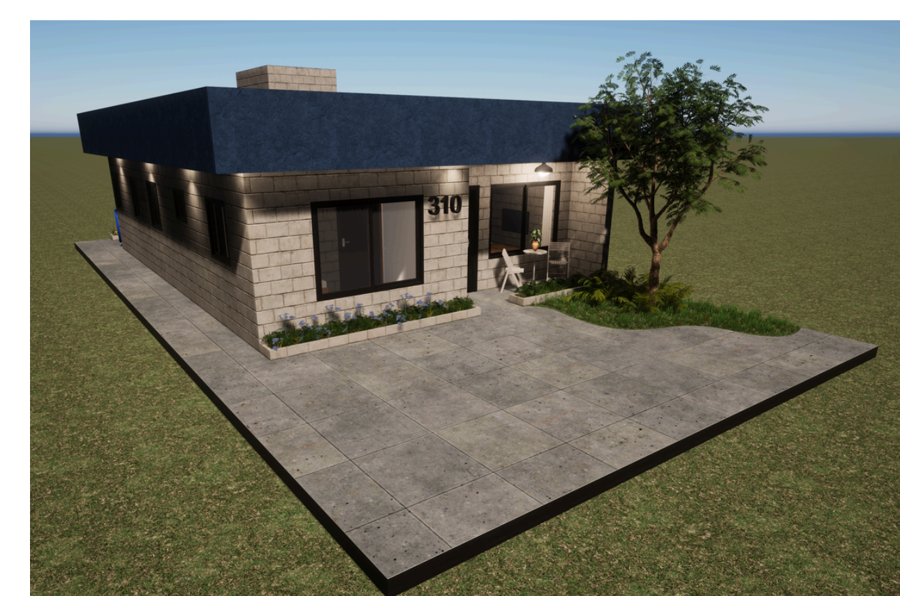
Vista frontal da tipologia

Considerando as famílias que precisarão ser realocadas, foi desenvolvido um projeto residencial unifamiliar com tipologia padrão, que acomoda até 8 pessoas. A proposta visa ser implantada em locais já designados dentro da própria gleba, assegurando a integração da comunidade.