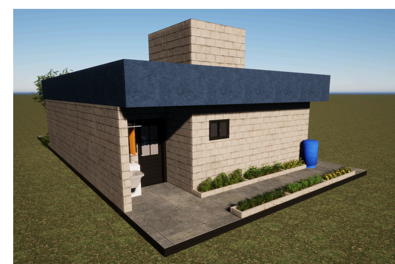
Vista posterior da tipologia