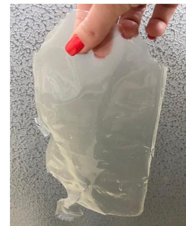
Figura 2 – Amostra de filme biodegradável produzido Figura 3 – Amostras enterradas para testar biodegradabilidade

Para a formação de um material termoplástico, é necessário que haja a destruição da organização dos grânulos de amido, através do processo de gelatinização. Esse, é a transformação irreversível do amido granular em uma pasta viscoelástica. Além disso, se faz necessário a adição de um plastificante para superar a fragilidade dos biofilmes. Um dos plastificantes mais indicados e usados é o glicerol, material que interage com as cadeias de amido através de pontes de hidrogênio (GERMANI, 2008).