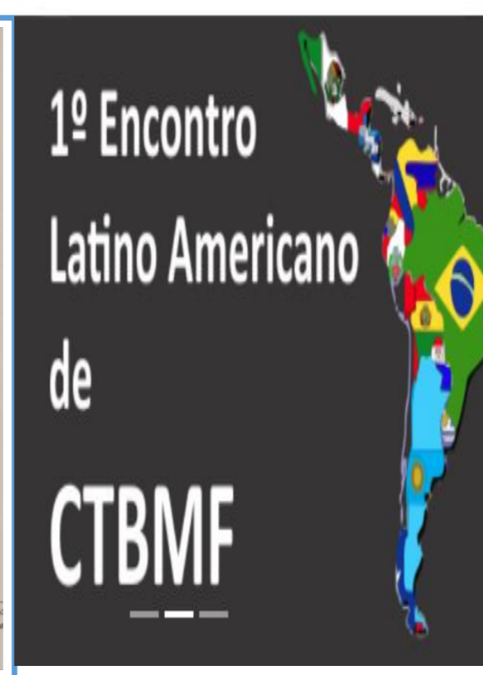
1º Encontro Latino Americano De CTBMF