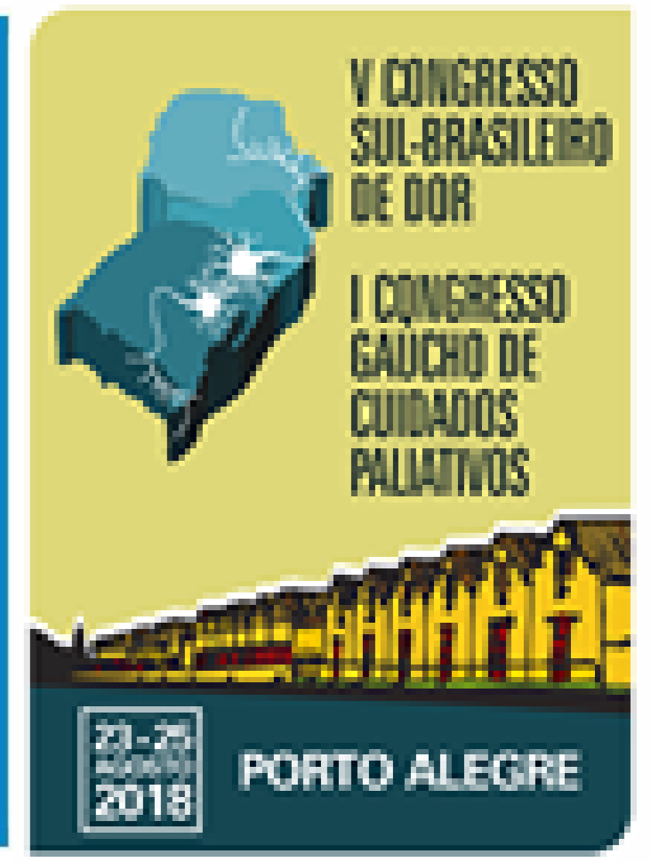
Participação no V Congresso Sul- Brasileiro de Dor 2018