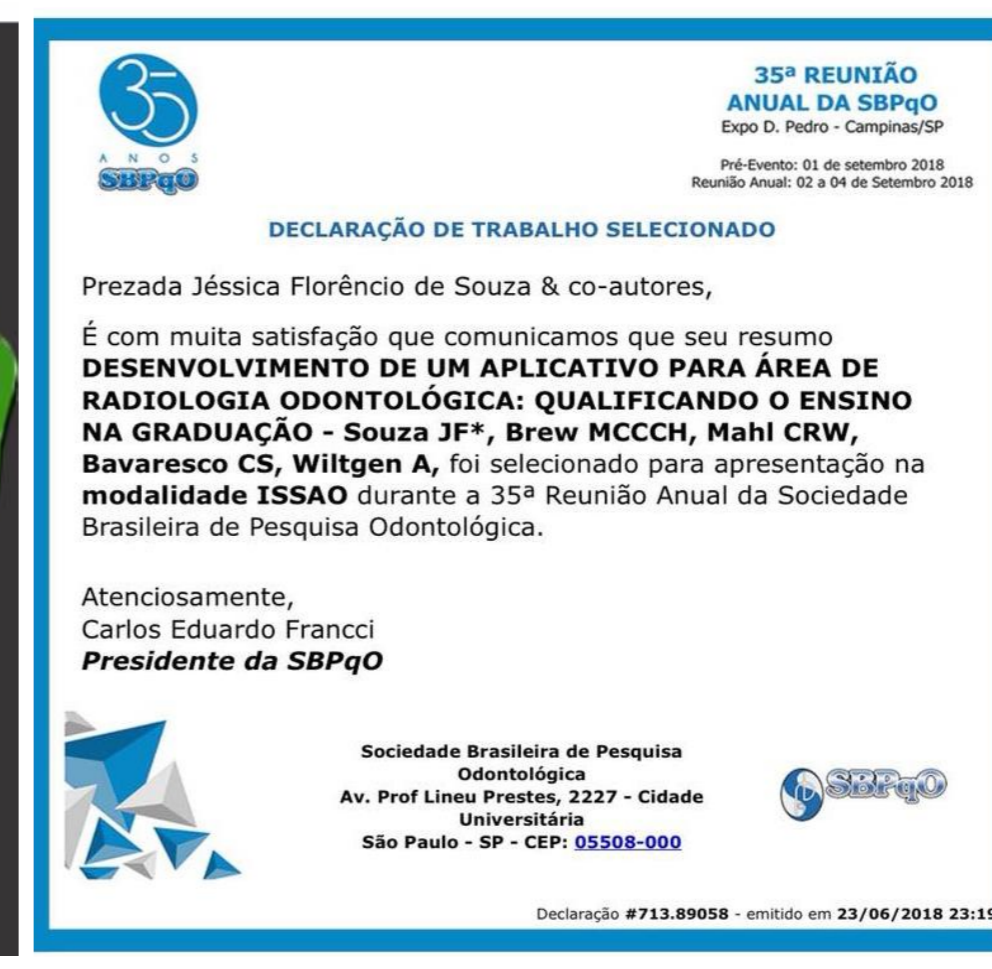
SBPqO: Trabalho selecionado para apresentação 2018