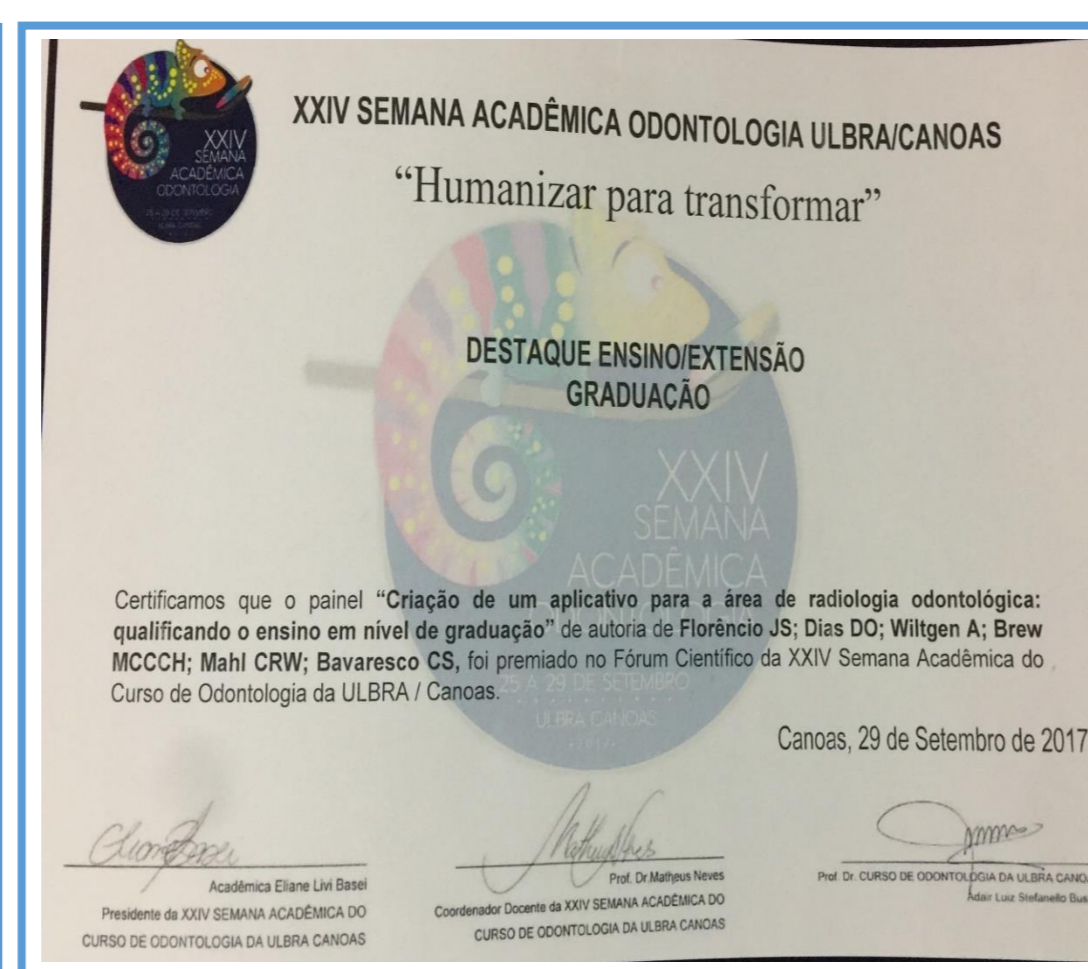
DESTAQUE ENSINO/EXTENSÃO GRADUAÇÃO 2017