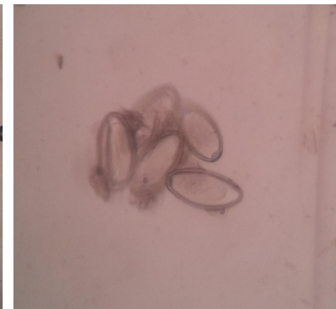
Figura 2: Ovos de Oxyuris sp.

Do total de amostras positivas, foram identificadas infecções simples em 36 (78,3%) e infecções mistas em 10 (21,7%), sendo a associação entre a superfamília Strongyloidea e o gênero Parascaris sp. a mais comum. O exame quantitativo de Gordon e Whitlock comparativamente ao exame de Willis-Mollay, identificou a presença de 45 (81,8%) amostras fecais positivas. Neste método foi possível avaliar a média de ovos por grama de fezes (OPG) nos animais positivos, que para Superfamília Strongyloidea foi de 628,6 OPG (50 a 3.600 OPG) e para o gênero Parascaris foi de 303,3 OPG (50 a 1.300 OPG). A cólica abdominal e o emagrecimento progressivo foram sinais clínicos descritos nos animais e que podiam estar relacionados aos parasitos intestinais diagnosticados, ainda que 96% dos proprietários relatassem o uso regular de anti-helmínticos.