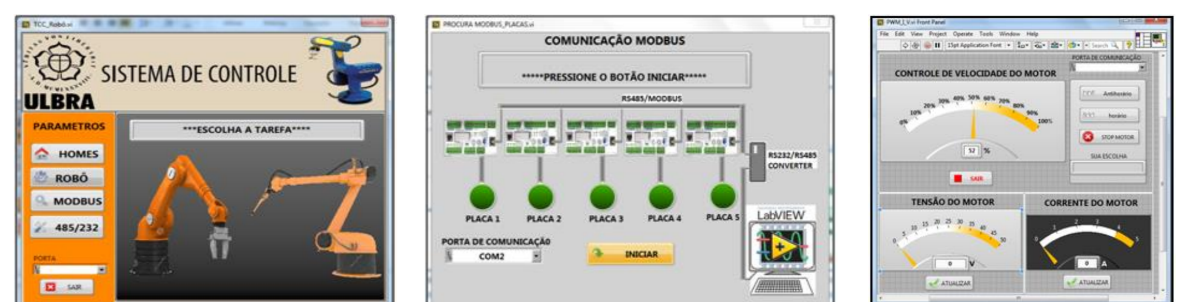
Figura 4 – Telas do software desenvolvido em LabVIEW.

De forma geral, a comunicação das cinco placas drive com o computador, via rede RS485/Modbus, ocorreu de forma estável, assim, cada tarefa do software (figura 4) teve funcionamento adequado. Para os acionamentos e leituras dos encoders do robô, foram feitos testes medindo-se a posição em 0°, 45°, 90° e 135°. Os primeiros testes (figura 5) tiveram resultados inadequados, pois, ocorreu um erro de quase 1° no movimento de 135°. Avaliando-se o problema, se concluiu era necessária uma desaceleração de 10% da velocidade no final do curso. Com isso, verificou-se um melhor comportamento do sistema (Tabela 1).