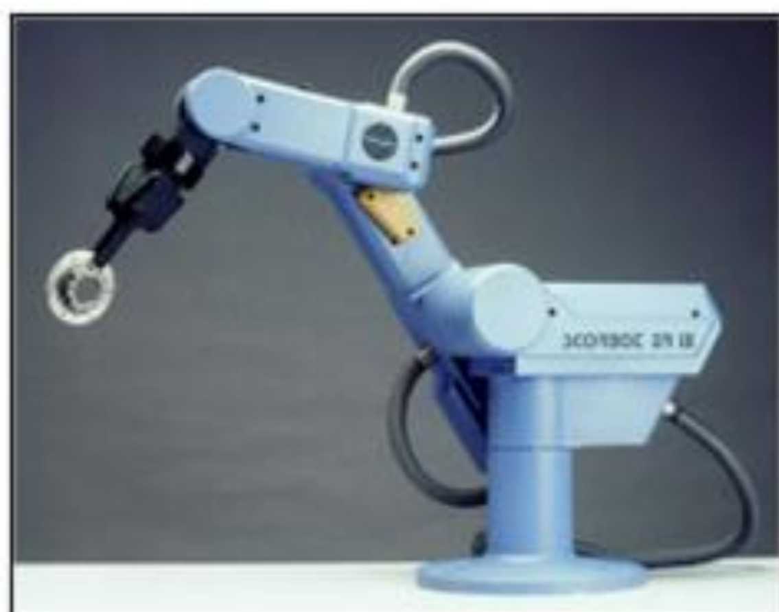
Figura 1 - Robô Scorbot IX.

Basicamente o projeto foi dividido em: Hardware (circuitos de potência, de leitura de V e I, microcontrolador, leitura do encoder, comunicação e I/O's para sensores de fim de curso dos eixos); rede RS485/Modbus; Firmware do microcontrolador; e software em LabVIEW. O robô disponível para os testes no LabCim foi um Scorbot ER IX (Figura 1), que possui cinco eixos com servomotor e encoder. Estes foram, então, acionados pelos drivers desenvolvidos (Figuras 2 e 3).