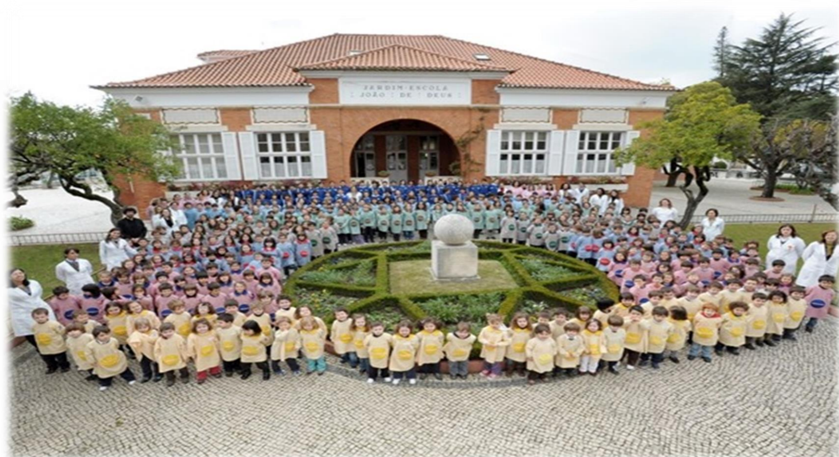
Figura 2: Jardim Escola João de Deus

A cartilha é apresentada como um grande livro na sala de aula e as lições são ministradas pela professora para pequenos grupos de alunos. Uma série de atividades são propostas de forma a fixar os conhecimentos aprendidos, tais como desenhar e pintar as letras com diferentes tipos de materiais, montar quebra-cabeças e caça palavras. A responsabilidade do professor é ajudar o aluno a conhecer o mundo, formar suas compreensões sobre si e sobre os aspectos sociais, bem como ajudar a expressarem-se e interagirem com outras pessoas, preocupando-se principalmente com o ritmo de aprendizagem individual dos alunos. Ao longo do semestre letivo foram observadas seis atividades com crianças de 3 a 5 anos: acolhimento, iniciação a leitura, introdução à matemática, atividades recreativas, alimentação e descanso. A observação foi realizada no Jardim Escola João de Deus em Coimbra (Figura 2), Portugal, no âmbito da disciplina Unidade de Observação e Intervenção da Universidade de Coimbra durante a participação do Programa de Licenciaturas Internacionais da CAPES (2010-2012).