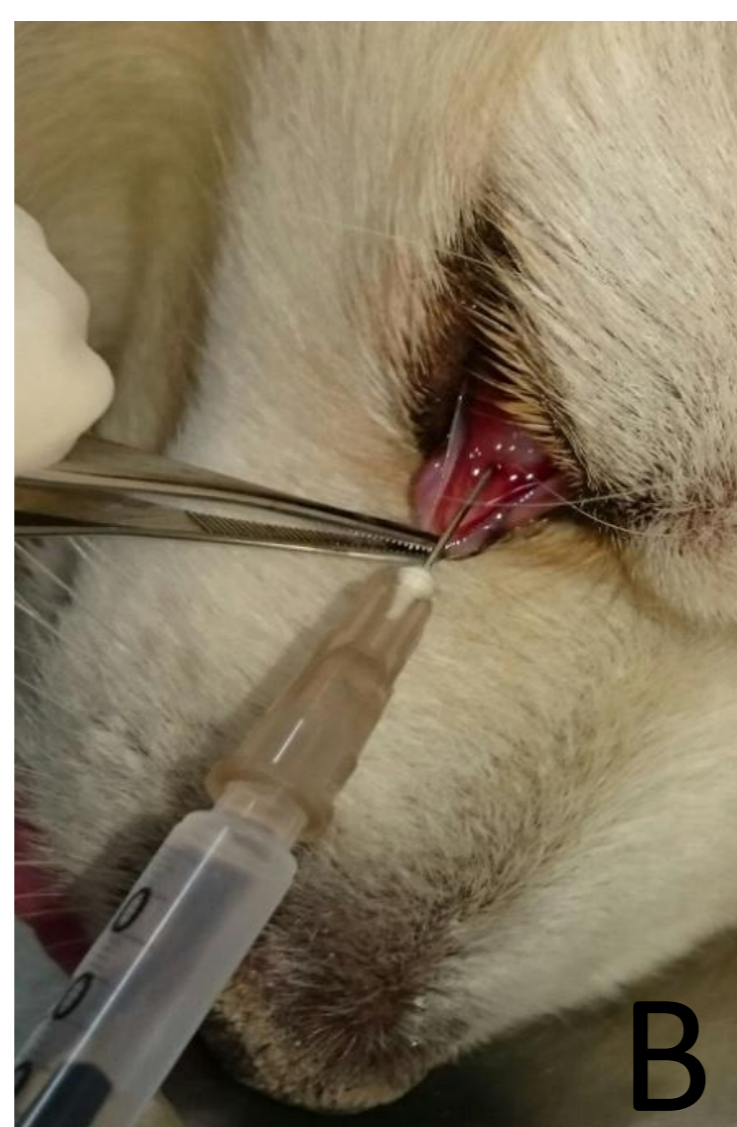
Figura 1 – Aplicação de células-tronco por via tópica (A) e por via injetável (B).