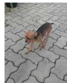
Figura 5: paciente apoiando o membro afetado