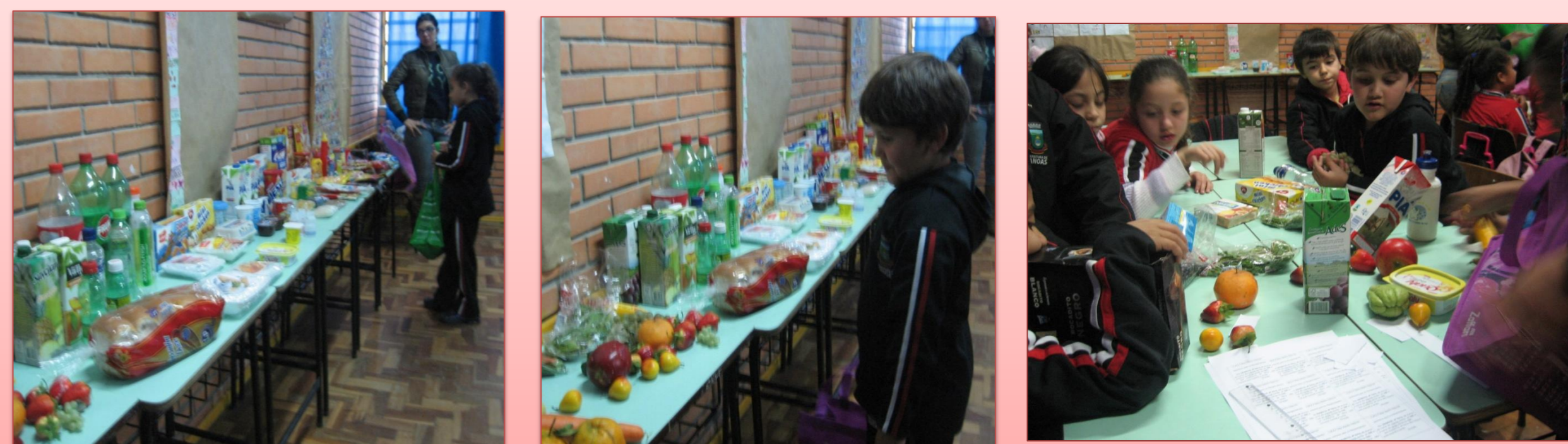
Figura 2: Alunos comprando os alimentos da atividade do supermercado. .