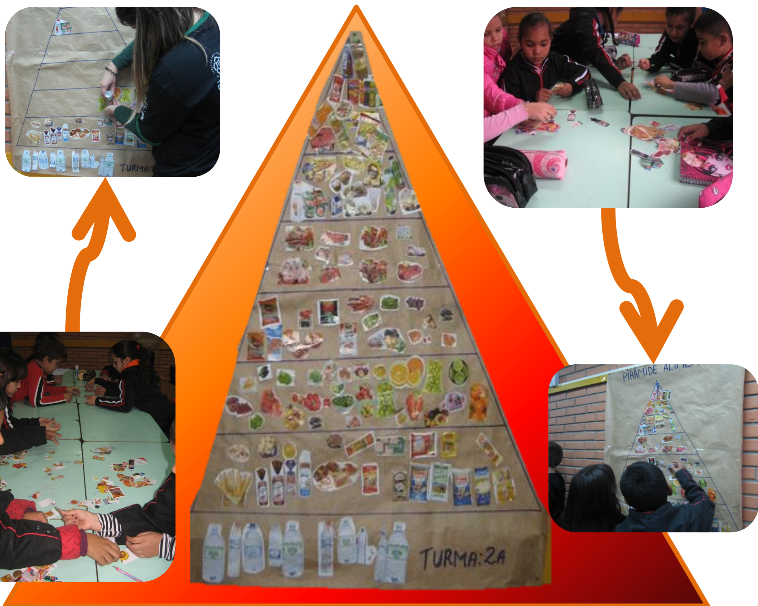
Figura 1: Alunos realizando a construção da Pirâmide Alimentar.

Alves, Ribar; Tanaka, Ana Lúcia; Anic, Cinara. Promovendo a alimentação saudável: uma proposta lúdica para o ensino da pirâmide alimentar. Niterói- RJ, 2012. Brasil. Secretaria da Educação Fundamental. Parâmetros curriculares nacionais: terceiro e quarto ciclos: apresentação dos temas transversais. Brasília- MEC, 1998. WELSH, S., DAVIS, C., SHAW, A. Development of the food guide pyramid. Nutrition Today, Annapolis, v.27, n.6, p.12-23, 1992b