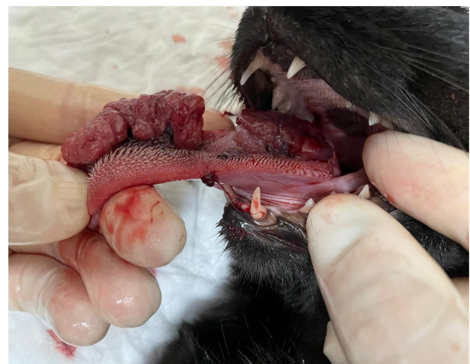
Figura 1: aumento de volume em língua de crescimento rápido