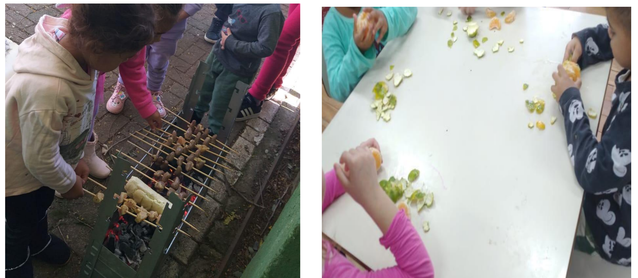
Imagens do cotidiano.