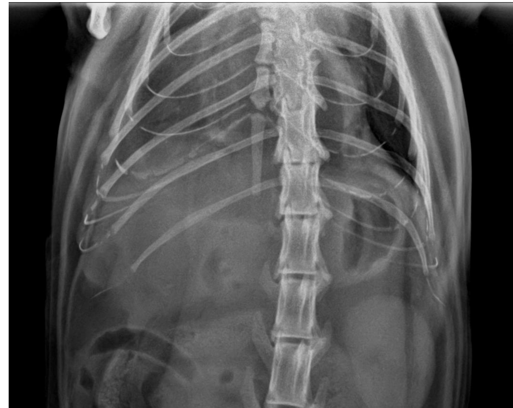
Figura 2 - Imagem de raio-x abdominal evidenciando a ausência de linha diafragmática.