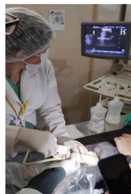
Figura 1 - realização de biópsia hepática.