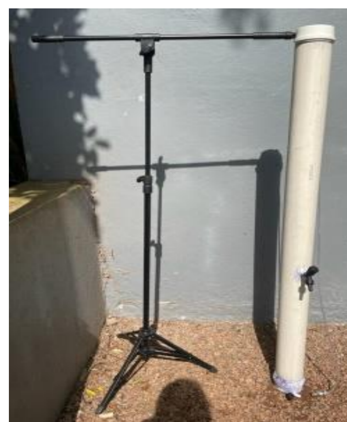
Figura 1: Reator piloto de absorção

A coluna piloto de absorção foi construída a partir de um tubo de PVC com diâmetro de 100 mm, recheada internamente com anéis de Rasching, onde o ozônio foi gerado pelo ozonizador do tipo Fotoirradiação por luz UV da marca GRAKO POA, sendo dosado no sistema através de uma pedra porosa. A Figura 1 representa a coluna piloto de absorção. A Figura 2 representa o esquema do reator utilizado nos ensaios de ozonização. Os ensaios de ozonização tiveram duração de 1h e foram realizados em triplicata. No fim dos experimentos foram realizadas as análises dos parâmetros pH, turbidez, sólidos totais fixos, sólidos totais voláteis, DQO, cor aparente e cor verdadeira no efluente bruto e no efluente ozonizado. Para quantificar a concentração e o fluxo gerado pelo ozonizador em sua vazão máxima de operação, foi utilizado o método iodométrico.