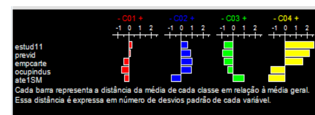
Figura 3. Traçado dos perfis das classes