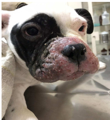
Figura 2. Canino com celulite juvenil após 10 dias de tratamento com prednisona e amoxicilina com clavulanato de potássio.