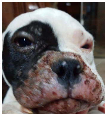
Figura 1. Alopecia, eritema e crostas em focinho de cão com celulite juvenil.

O animal foi levado para consulta com um quadro de dermatopatia localizada em face, letargia e anorexia. Ao exame específico, a pele estava eritematosa, com presença de alopecia e crostas (Figura 1). O raspado parasitológico cutâneo excluiu demodicose canina e então a suspeita de celulite juvenil foi estabelecida. O tratamento foi prescrito a base de prednisona na dose de 2 mg/kg por via oral com redução da dose após melhora clínica e no uso de amoxicilina com clavulanato de potássio na dose de 20 mg/kg por via oral durante 2 semanas. Decorridos 10 dias de tratamento, o animal veio para retorno, sendo possível observar uma melhora significativa no aspecto das lesões (Figura 2), estava mais ativo e alimentando-se normalmente. Foram realizadas revisões semanais com evolução clínica e dermatológica positiva (Figura 3).