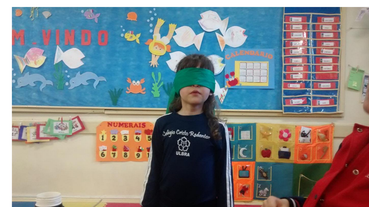
EXPERIÊNCIA DO PALADAR