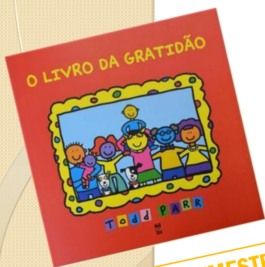
LITERATURA DO SEMESTRE