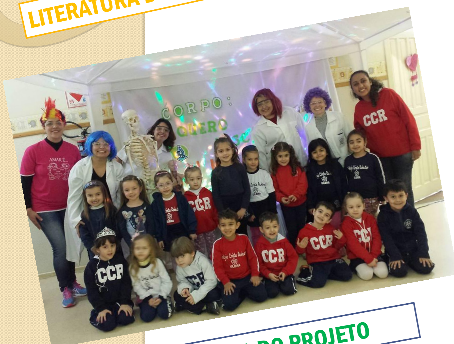
ABERTURA DO PROJETO

O estudo do corpo humano é sempre um tema instigante e que as crianças da educação infantil demonstram muita curiosidade. A exploração do mesmo se faz necessária para levá-los a conhecerem-se melhor, desenvolvendo assim o esquema corporal, e também para aprenderem a valorizar o próprio corpo e compreender a função de cada parte dele.