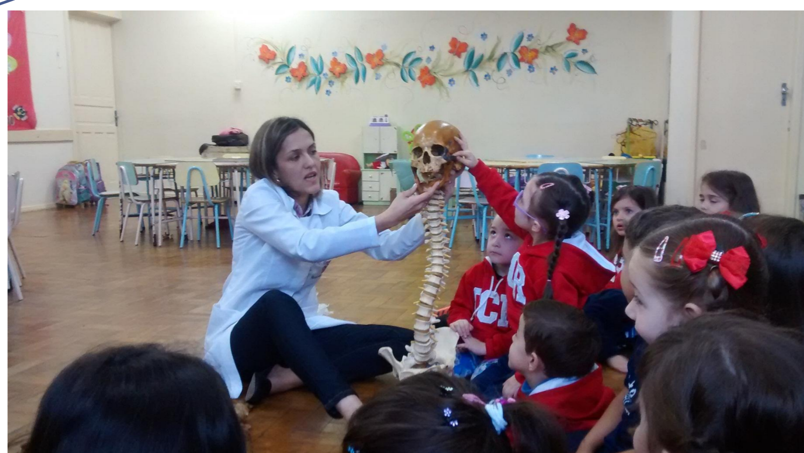
AULA PRÁTICA COM UMA BIÓLOGA: CONHECENDO O ESQUELETO HUMANO