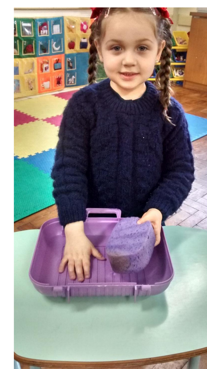
EXPERIÊNCIA: A FUNÇÃO DA PELE