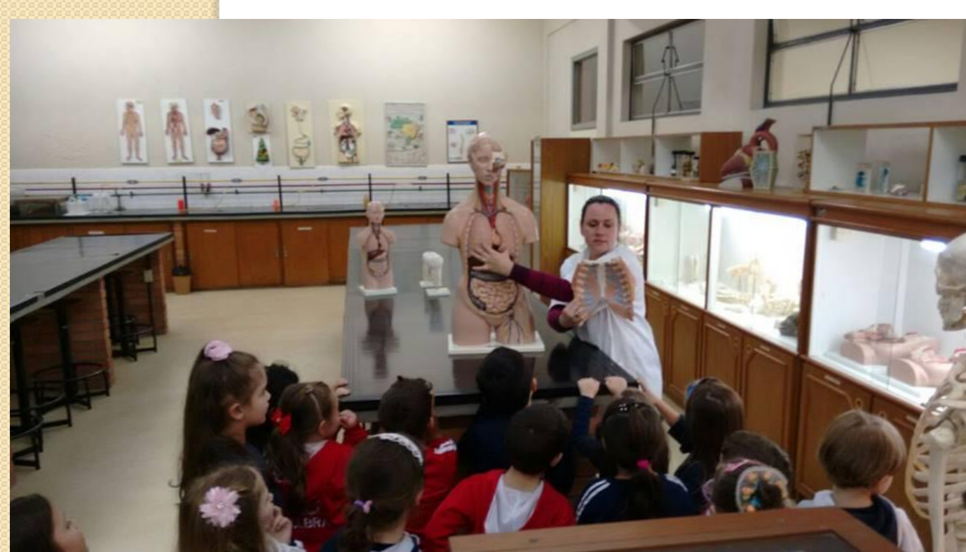
AULA PRÁTICA NO LABORATÓRIO DE BIOLOGIA