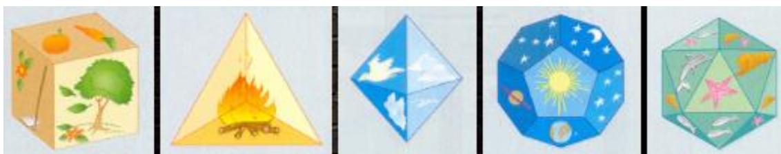
Figura 1- Sólidos associados aos elementos primordiais 5

Ao que se refere aos poliedros regulares 3 , o manuseio de materiais concretos favorece uma perspectiva tridimensional dos sólidos facilitando a interpretação das representações matemáticas entre as figuras no espaço. São cinco os poliedros regulares, também conhecidos como sólidos Platônicos 4 . A esses sólidos Platão estabeleceu uma relação mística com o mundo. Para Platão os cinco sólidos: hexaedro, tetraedro octaedro, icosaedro e dodecaedro representavam respectivamente, a Terra, o fogo, o ar, a água e o universo, conforme ilustra a Figura 1.