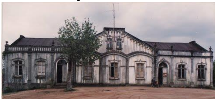
Figura 1 - Casa dos Leitzke