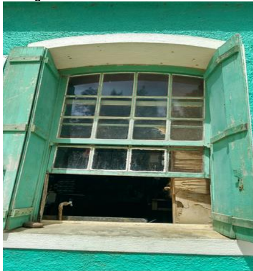
Figura 4 – Janela no estilo Guilhotina