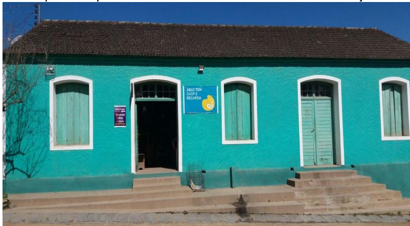
Figura 3 – Arquitetura pomerana com detalhes característicos das janelas e portas

Abaixo, na figura 3, uma típica casa Pomerana que contempla detalhes característicos.