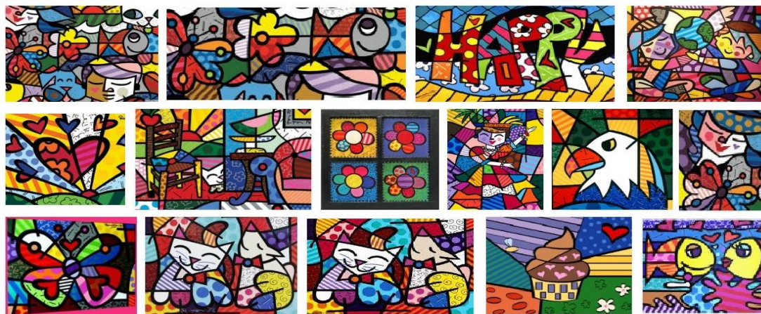
Figura 1 - Algumas pinturas de Romero Britto

dos ângulos internos e externos de polígonos. Queríamos uma atividade que os alunos pudessem fazer suas próprias verificações, algo que eles tivessem como medir. Como a professora de Artes estava disposta a ajudar, pensamos em trabalhar com obras que tivessem relação com polígonos, como as pinturas de Romero Britto.