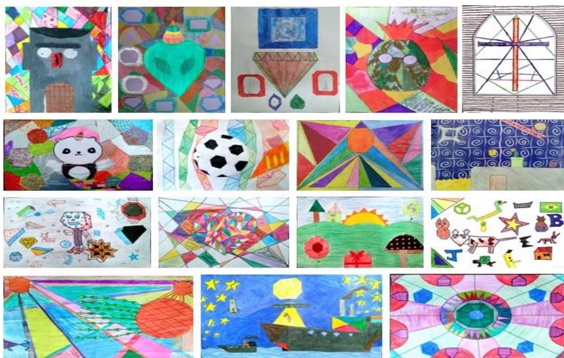
Figura 2 - Obras dos alunos

questionamos. Uma menina respondeu: "Os polígonos, sora!" Era o que precisávamos para fazer-lhes a seguinte proposta: "Vocês serão os artistas agora. Farão suas obras, como as do Romero Britto." Uma aluna perguntou: "Com muitos e muitos polígonos, sora?" Respondemos que sim e, quanto mais diversos, melhor seria. Durante algumas aulas fizeram suas pinturas. Alguns alunos reclamavam, perguntavam "quando essa chatice iria acabar e quando iria começar a matemática"? Achamos engraçado, pois pensávamos que todos iriam gostar de desenhar e pintar. E respondemos: "quem disse que isso não é matemática?" O aluno ficou olhando, com um ar pensativo.