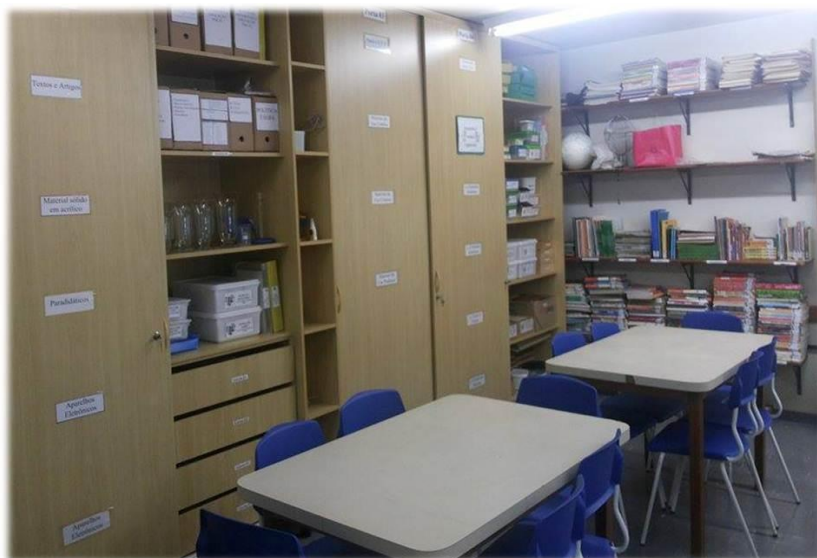
Figura 3 – LEAM da ESEBA

Assim que os materiais foram separados, destinou-se uma prateleira para cada eixo, devidamente identificadas.