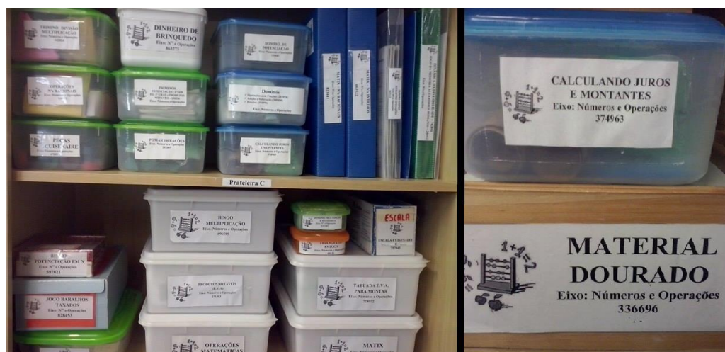
Figura 3 – Modelo de etiqueta dos materiais manipuláveis e sua organização no armário

Os materiais didáticos foram acomodados em recipientes plásticos e etiquetados externamente. As etiquetas foram compostas pelo nome do material, a qual eixo dos PCN's ele pertence e o código do sistema, como mostram as Figuras 2 e 3.