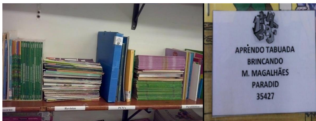
Figura 2 – Modelo de etiqueta de livros e organização na prateleira

Os livros foram dispostos em uma prateleira separados por categoria, usando critérios como: ano/série, paradidáticos, de orientação pedagógica, revistas pedagógicas e documentos oficiais, como os Parâmetros Curriculares Nacionais (PCN's). Os artigos e textos foram arquivados em caixas próprias para este fim, devidamente etiquetadas.