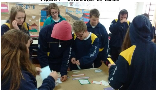
Figura 7 - Construção do cartaz