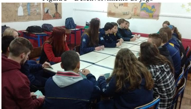
Figura 5 - Desenvolvimento do jogo

Usado para fixar o conteúdo sobre função afim, esse recurso possibilitou mais uma forma de aprendizado, um jogo conhecido entre a maioria dos estudantes, o Dorminhoco desperta a atenção e o raciocínio já que precisa estar atento aos demais participantes e ao mesmo tempo em suas cartas.