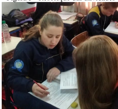
Figura 3 - Resolução das atividades