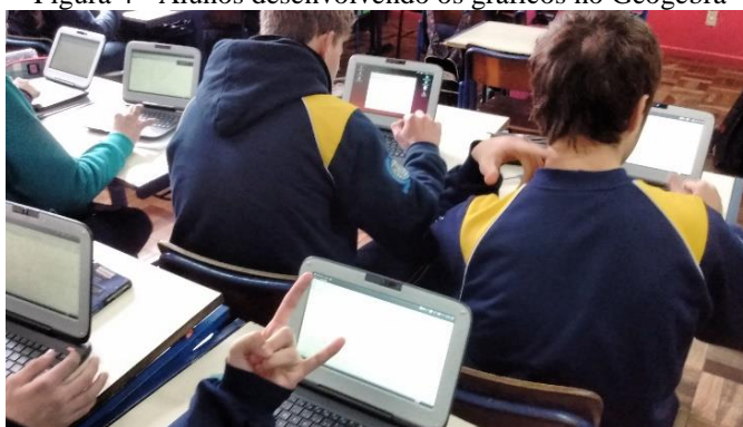
Figura 4 - Alunos desenvolvendo os gráficos no Geogebra