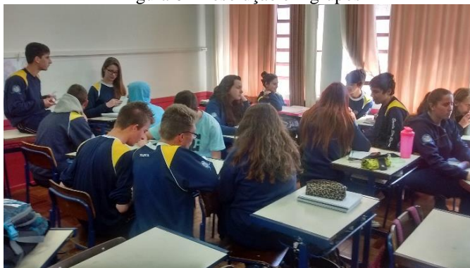
Figura 6 - Resolução em grupos

A aprendizagem cooperativa é definida como um conjunto de técnicas de ensino em que os alunos trabalham em pequenos grupos e se ajudam mutuamente, discutindo a resolução de problemas facilitando a compreensão do conteúdo. (FIRMIANO, 2011, p.5)