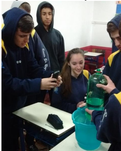
Figura 8 - Iniciando o experimento

do processo de desenvolvimento escolar dos alunos e também sobre seu próprio processo de ensino. Desta forma a avaliação fica restringida a um processo apenas de verificação, o qual julga erroneamente o aprendizado do aluno. (LIMA, 2013, p. 14)