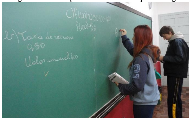
Figura 2 - Resolução de atividades no quadro-negro

No ensino tradicional da matemática, é possível observar que o processo de ensino apenas o professor transmite e os alunos recebem e realizam de forma repetitiva e mecanizada os exercícios, acarretando, por parte do aluno, memorizações de como estes exercícios foram desenvolvidos (cabendo ao aluno a responsabilidade em aprender) [...] mas não funciona com todos, pois as características individuais são determinadas por fatores externos ao indivíduo. (VITAL, 2011)