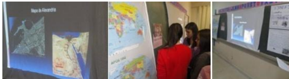
Figura 2: Socialização da atividade 2 apresentada pelo G2.

A equipe (G2) ficou responsável por investigar e apresentar usando recursos tecnológicos os grandes matemáticos gregos do séc. VI a.C até o séc. II a.C que contribuíram para o modelo de pensamento geométrico trabalhado em sala de aula. Para esta atividade, os estudantes do G2 buscaram juntamente a dados bibliográficos impressos e na internet, informações que contribuísse para a montagem da apresentação. A figura 2 ilustra o momento da socialização da atividade 2.