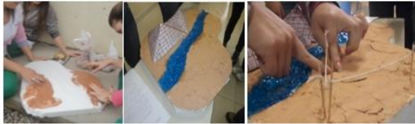
Figura 1: Representação do processo da atividade 1 desenvolvida pelo G1