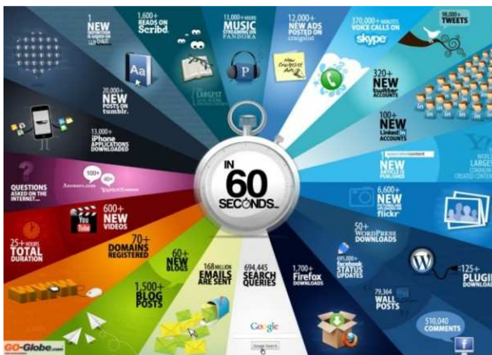
Figura 1 - Infográfico 60 segundos na Web

72 horas de vídeos enviados no Youtube 7 , 98.000 twetts , 70 novos domínios registrados, 60 novos blogs e 1500 posts , 510.040 comentários no Facebook , 6.600 novas fotos no Flickr , 1 novo artigo será publicado e 40 novas dúvidas no Yahoo Answers e 100 no answers.com (TECHNET, 2013). Se o que move o mundo realmente forem as perguntas, temos aí pelo menos mais 140 questionamentos que continuarão a girar o mundo das informações. Por meio da incorporação do uso da Internet e dos recursos tecnológicos nas sociedades (ROSA; VANINI; SEIDEL, 2011, p. 1) e com a Web 2.0 8 gerou a oportunidade dos internautas colaborarem com a construção do conteúdo disponibilizado na rede mundial de computadores, o que vem gerando um número crescente de informações todos os dias.