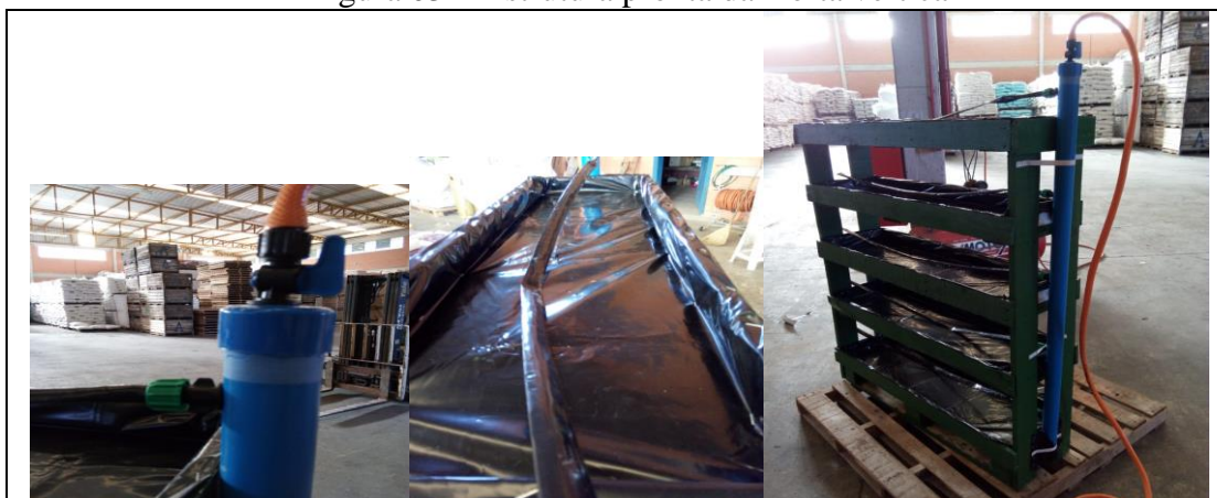
Figura 03 - Estrutura pronta da Horta vertical

Já em fase de acabamento (Figura 03), podemos ver a estrutura construída com lonas e irrigação.